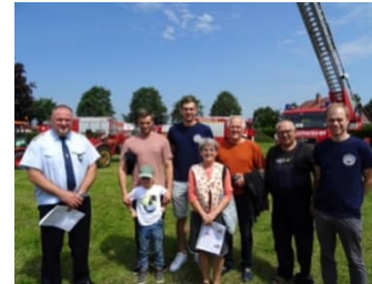
Der GKR Wieglitz gratuliert der FFW Bülstringen zum 100-jährigen Bestehen