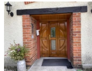
Die Eingangstür der Kirche Wieglitz erhielt einen neuen Anstrich