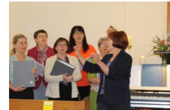
Frühlingskonzert mit dem Kirchenchor