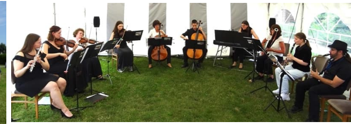
Konzert der Kreismusikschule HDL/WMS